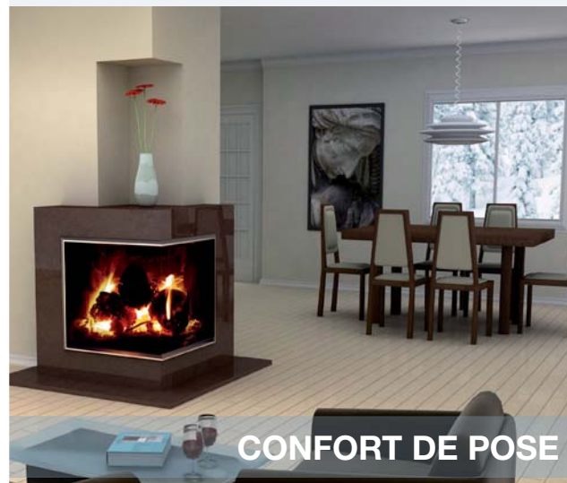
CONFORT DE POSE